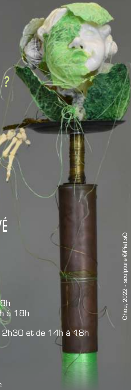
Chou, 2022 - sculpture