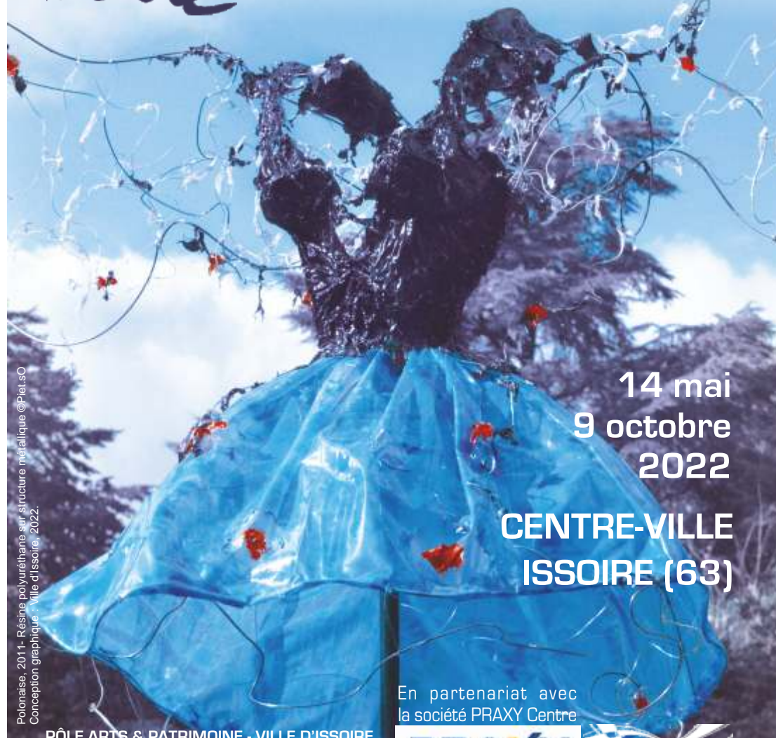
Polonaise, 2011 - Résine polyuréthane sur structure métallique ©Piet.sO Conception graphique : Ville d'Issoire, 2022.